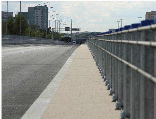
Autostrada Warszawa Polska